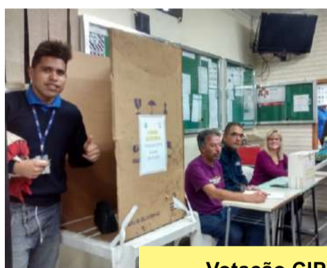
Votação CIPA Nortran