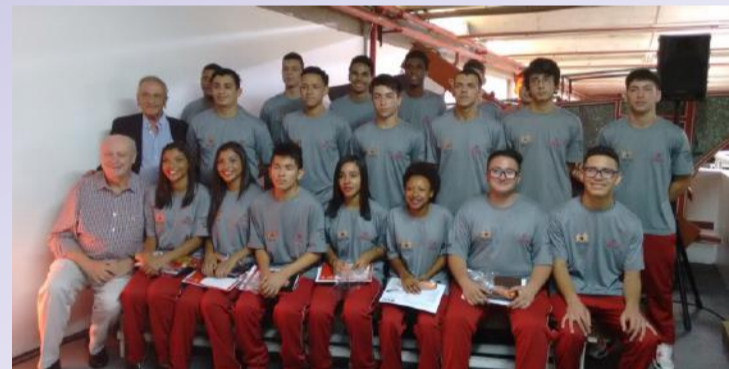
A Equipe Nortran parabeniza os Formandos!

Dia 09 de dezembro de 2016 ocorreu a formatura dos Aprendizes do Projeto Pescar, contratados pela Empresa Nortran, no Curso de Iniciação Profissional em Mecânica Automotiva na Empresa Zensul-Revenda Honda.